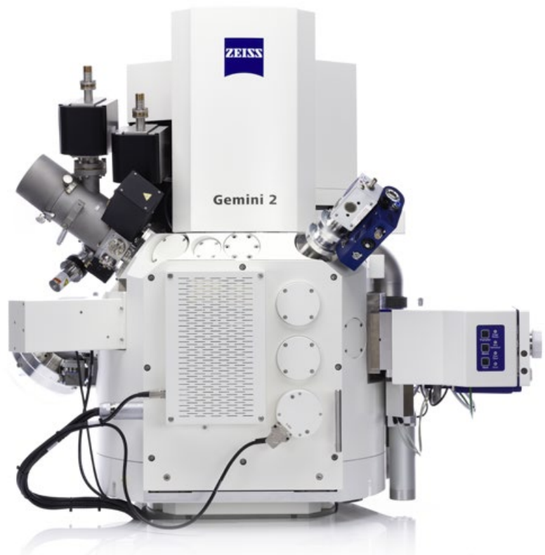
ZEISS Crossbeam zur Analyse von Materialbeschaffenheit im Nanometerbereich.

Die BMW Group in München ist mit Modellen wie BMW i3 und i8 ein Vorreiter bei elektrischen Premiumfahrzeugen. Auch die neuen Aufgaben der Qualitätssicherung in diesem Kontext gehen die Münchner daher mit Premiumanspruch an. So kombiniert der Bereich Technologie Werkstoff- und Verfahrensanalytik beispielsweise mehrere ZEISS Mikroskoptypen, um Komponenten wie Batteriemodule und -zellen sowie Platinen für Elektronik-