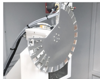
Ein automatisiertes Filterrad, eingebaut im ZEISS METROTOM 800.

* Die Nachrüstung für das Filterrad ist nur für ZEISS METROTOM Systeme verfügbar, die schon mit ZEISS METROTOM OS 3.6 betrieben werden.