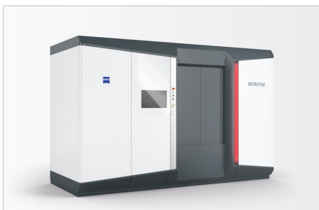
Das automatisierte Filterrad ist für die gesamte ZEISS METROTOM Familie verfügbar.