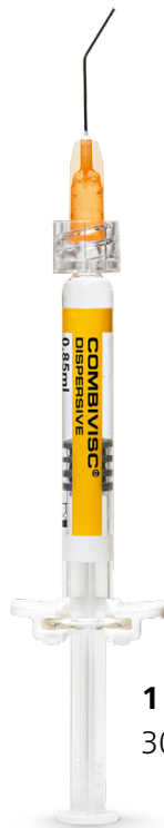
1 OVD dispersif 30 mg/ml, 0.85 ml