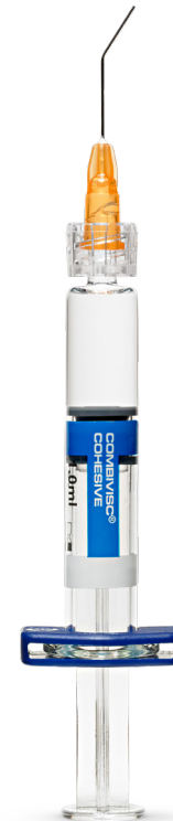
1 OVD cohésif 15 mg/ml, 1.0 ml