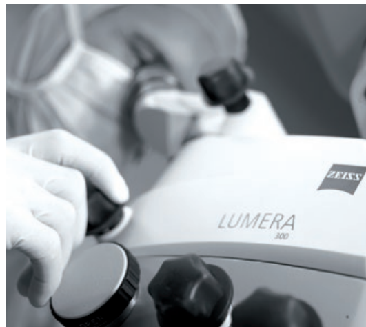
Découvrez une qualité inégalée

Les packs de service de ZEISS assurent une maintenance préventive et corrective ainsi que l'approvisionnement en pièces détachées, pour un temps de service maximisé et une facilité d'emploi optimale.