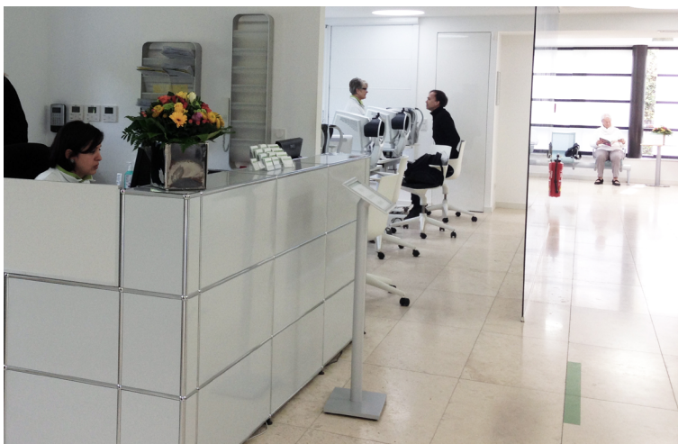
Rezeption und Untersuchungsbereich für Patienten mit Grauem Star.