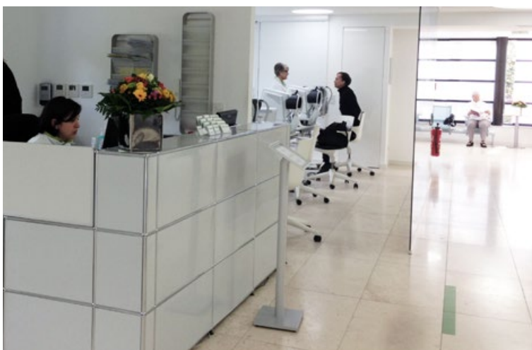
Rezeption und Untersuchungsbereich für Patienten mit Grauem Star.