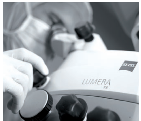
Erleben Sie Qualität der Extraklasse

Zudem sorgen die OPTIME Servicepakete von ZEISS mit Leistungen von der vorbeugenden Wartung bis zur Instandsetzung, inklusive Ersatzteilen, für ein Maximum an Systemverfügbarkeit und Komfort.