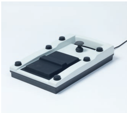
Panel de pedal ergonómico

Microscopio de asistente, cámara HD, sistema de reproducción del fondo ocular ZEISS RESIGHT 500: todas las piezas y accesorios están totalmente integrados, sea cual sea la configuración. Además, al usar el cómodo y ergonómico panel de pedal puede concentrarse en sus intervenciones sin distracciones ni interrupciones.