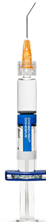
1 OVD cohesivo 15 mg/ml, 1,0 ml