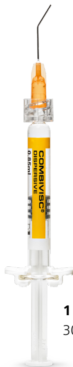
1 OVD dispersivo 30 mg/ml, 0,85 ml