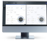
ZEISS EQ Workplace ZEISS VERACITY Surgery Planner

Un plan chirurgical est envisagé pour votre patient.