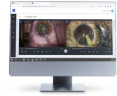
ZEISS Surgery Optimizer

Les vidéos sont directement disponibles sur ZEISS Surgery Optimizer via un navigateur Web ou une application*.