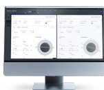
ZEISS EQ Workplace ZEISS VERACITY Surgery Planner

Se valora un plan quirúrgico para su paciente