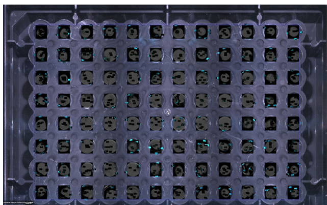
一幅 96 孔板的概览图像, 显示了所获得的透射光和荧光成像的确切位置。